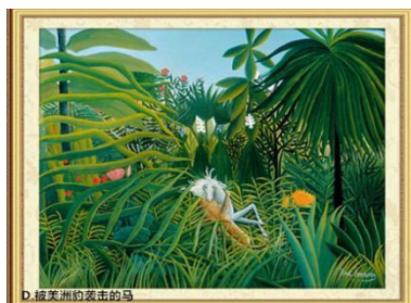
D. 《被美洲豹袭击的马》